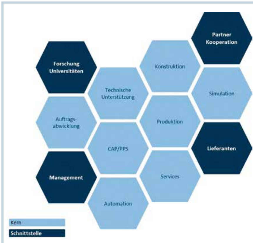
4 Schema der zentralen Informationsströme innerhalb des Produktionsmanagements mittels ToolProduction

den Module des Unternehmens – sowohl das ERP-Warenwirtschaftssystem als auch das MES System – integriert werden. Der Richtlinie VDI 5600 folgend, sollen diese IT Module auf einer Bedienoberfläche abgebildet werden, deren Standard im Rahmen dieses Projekts entwickelt werden soll.