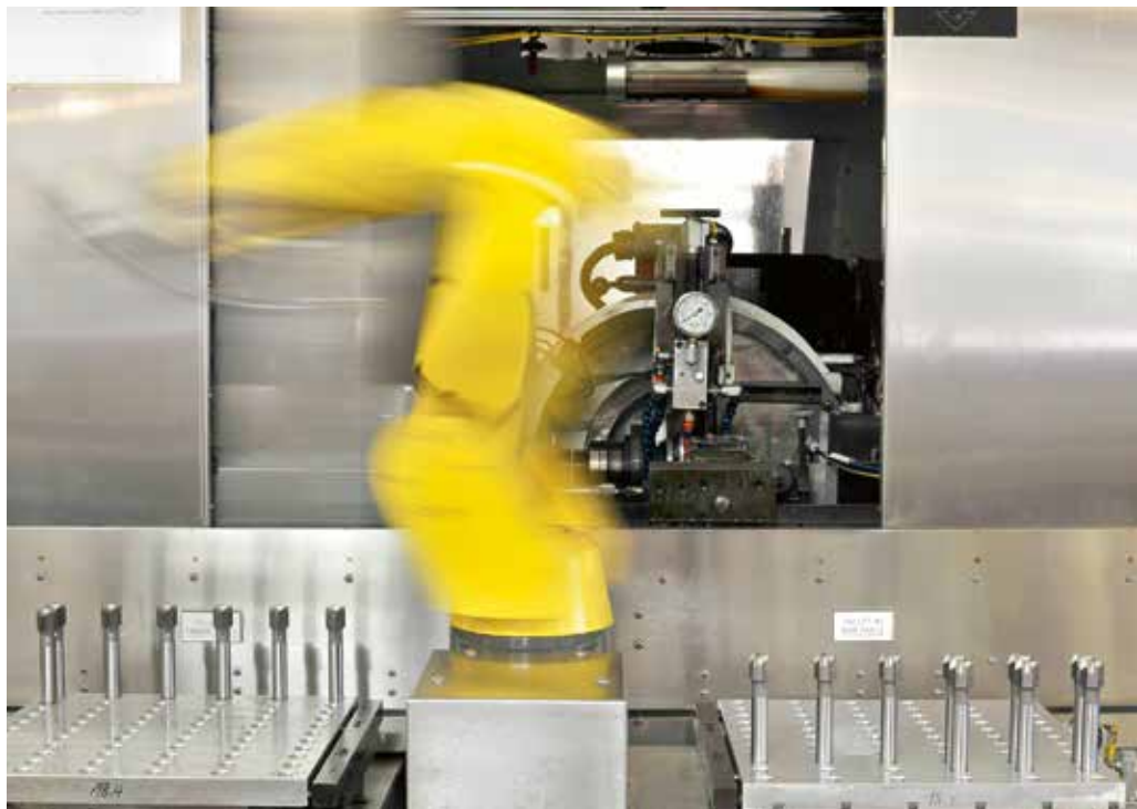
1 Steigender Automatisierungsgrad und zunehmende digitale Vernetzung machen die Fertigung von Präzisionswerkzeugen zu einem vorrangigen Bewährungsfeld für digitale Strukturen als Basis einer Industrie 4.0

Mit dem Fokus auf eine Prozesslenkung nach den Vorgaben von Industrie 4.0 gibt es für eine erfolgreiche Realisie-